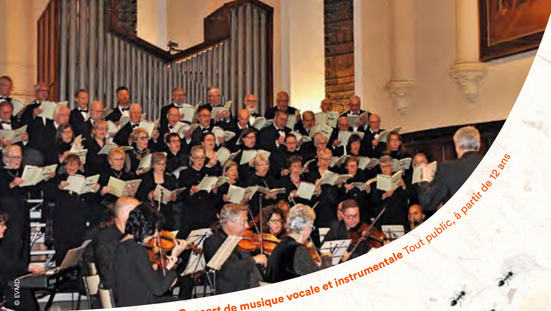
Concert de musique vocale et instrumentale Tout public, à partir de 12 ans