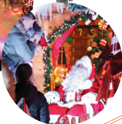
Fête des lumières