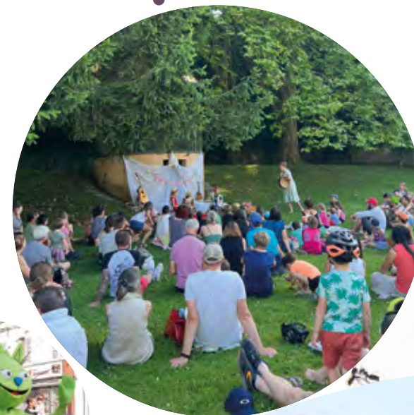
Fête du Miron