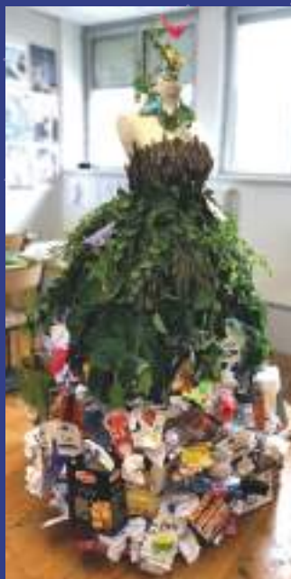
Création Lycée Elie Cartan, année 2019