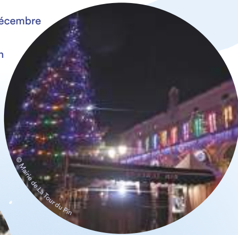
Fête des lumières