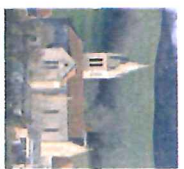
Croix du Poutat