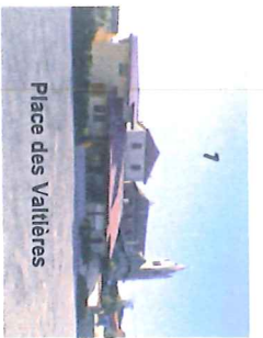
Place des Valtières