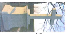
Croix de Champpe